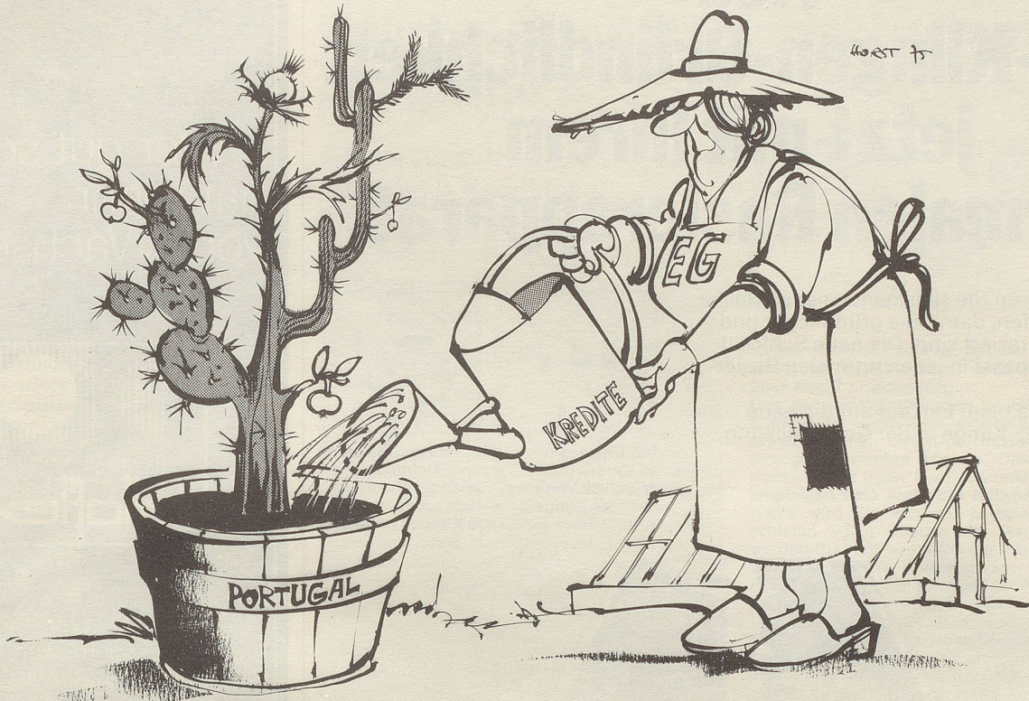
«... scheint auf jeden Fall ein Obstbaum zu werden.»