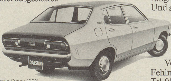
Datsun Sunny 120Y Limousine Fr. 10 950.- Automat + Fr. 950.-

Verlangen Sie bitte Unterlagen bei Fehlmann Motor AG, 8902 Urdorf, Tel. 01/79 90 11.