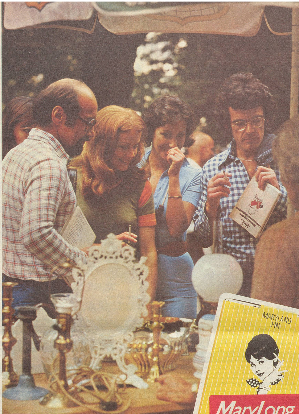
Eine Mary Long-Länge lang feilschen ist auch ein Vergnügen.