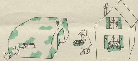
Freundnachbarliche Beziehung von Haus zu Haus.