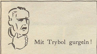
Mit Trybol gurgeln!

Am Leben ist noch die blonde Schwester irgendwo in den Vereinigten Staaten, wo ihr Sohn eine recht ansehnliche Staatsstellung hat. Und ich.