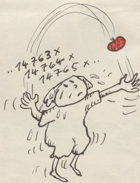
Schlank sein beginnt mit einem Apfel!