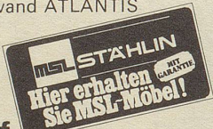
Bild: Wohnwand ATLANTIS beliebig zusammenstellbar

Über Geschmack lässt sich streiten. Darum haben wir in unserer grossen Ausstellung ein umfangreiches Angebot in den verschiedensten Stilarten ausgestellt. Hier finden auch Sie das Möbel, welches Ihren besonderen Vorstellungen entspricht. Auch eine Riesenauswahl an Orient- und Spannteppichen, Polstergruppen, Lampen, Einbauschränken und allem, was zum Wohnen gehört, macht unsere Fabrik-Ausstellung sehenswert.