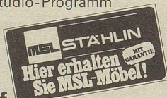
Bild: MSL-Studio-Programm beliebig zusammen- stellbar

Über Geschmack lässt sich streiten. Darum haben wir in unserer grossen Ausstellung ein umfangreiches Angebot in den verschiedensten Stilarten ausgestellt. Hier finden auch Sie das Möbel, welches Ihren besonderen Vorstellungen entspricht. Auch eine Riesenauswahl an Orient- und Spannteppichen, Polstergruppen, Lampen, Einbauschränken und allem, was zum Wohnen gehört, macht unsere Fabrik-Ausstellung sehenswert.