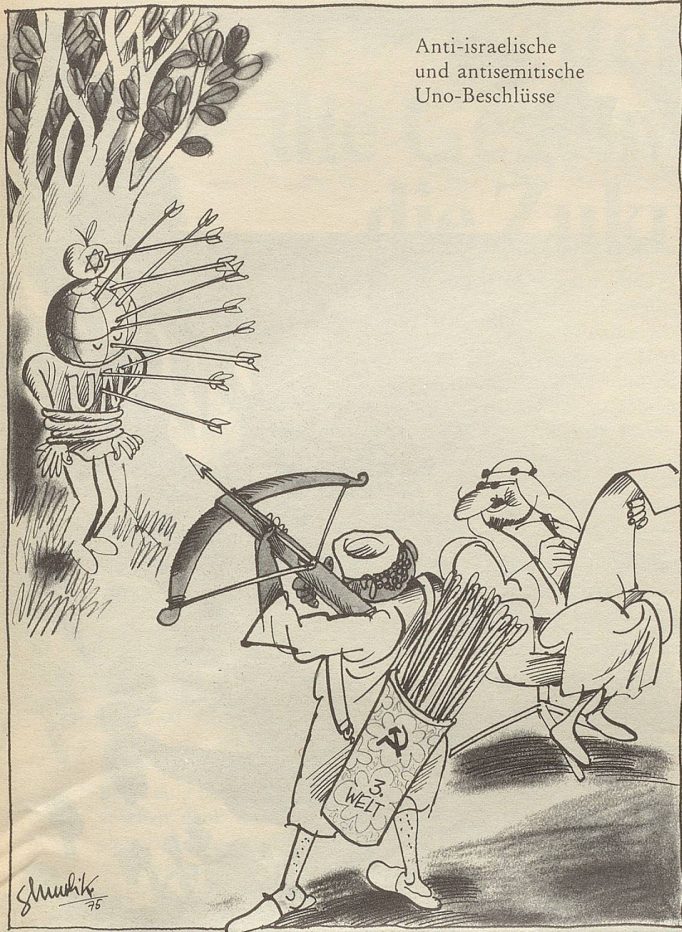
Anti-israelische und antisemitische Uno-Beschlüsse