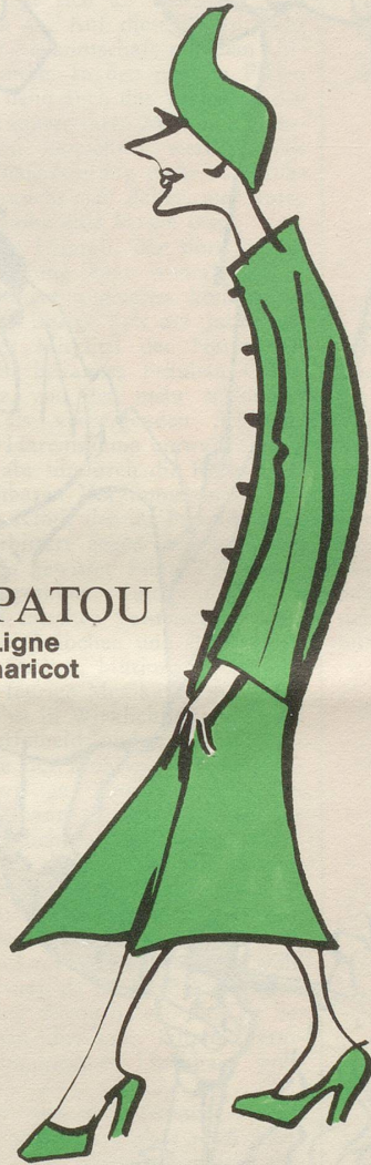
PATOU Ligne haricot