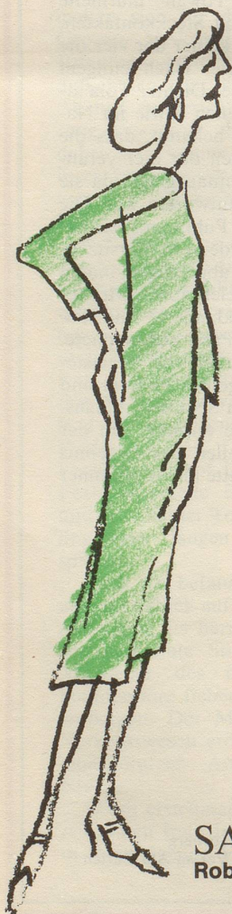
SAINT LAURENT Robe tube