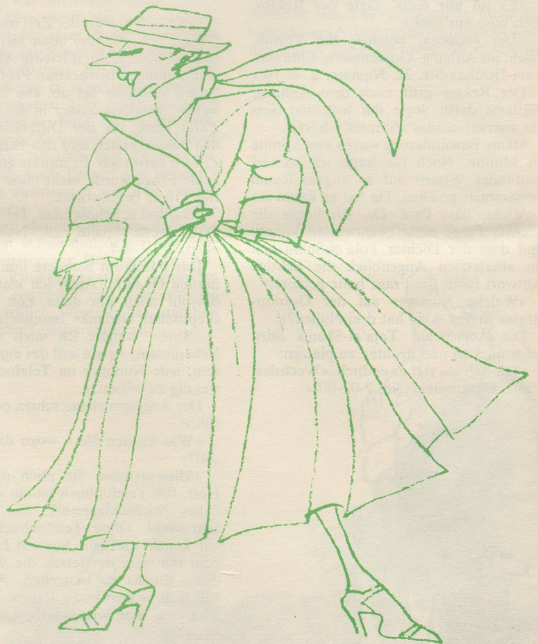
SCHERRER Une corolle