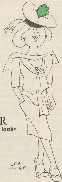
DIOR «Le naif look»