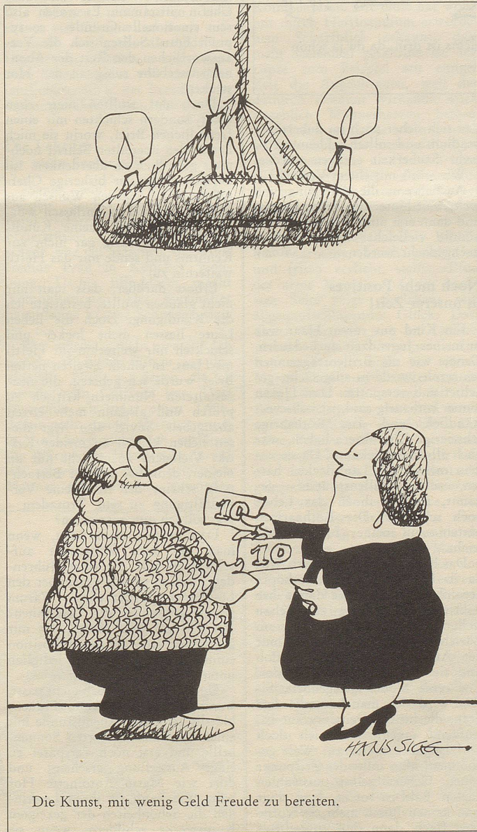
Die Kunst, mit wenig Geld Freude zu bereiten.