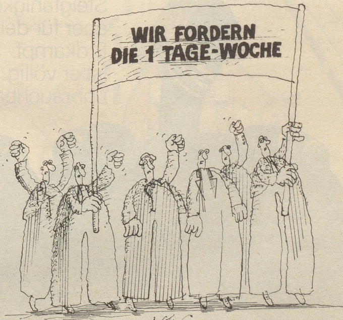
Eine neue Streikwelle erschüttert das Industriequartier von Winterthur.

Senkrecht: 1 heiliger Vogel der alten Ägypter; 2 schützten Feld, Haus und Familie der alten Römer; 3 sie können seinen Palast in Venedig bewundern; 4 (Triumph) bogen von Paris; 5 leiten einen ganz besonderen Saft; 6 türkischer Titel; 7 Vorfahren von 1875 oder früher; 8 die Laugen des Chemikers; 9 enthält Metalle; 10 Insel im Roten Meer; 11 höchster im germanischen Götterhimmel; 12 im Jahre 2075 wird wohl jeder eine Seilbahn haben; 13 Beethoven hat ihr ein Albumblatt gewidmet; 14 Nationale Gesellschaft; 15 Heimat der Medea in Kolchis; 16 Kilo-Hertz; 17 seine Zukunft liegt im Brot; 18 kleiner göttlicher Heckenschütze; 19 südeinglische Stadt mit berühmtem College; 20 könnte einmal eine Pflanze werden; 21 im besonderen; 22 kurzes Längenmass; 23 grosser Auftritt des Musikers; 24 sie zeigte mit dem Öl-zweig schon Noah eine bessere Zukunft; 25 seine Wiege ist das Engadin; 26 französischer Artikel; 27 Fussballerzahl; 28 wird auch in hundert Jahren noch in Russland fliessen; 29 schlechte Charaktereigenschaft; 30 Stadt und Badeort bei Rostock; 31 Dehnungslaut; 32 Buchstaben im Beizli; 33 sein Nachfahre ist das heutige Rind; 34 möchten am liebsten heute schon die Welt von morgen schaffen; 35 Sprosse der Tonleiter; 36 Ausruf auf der Geisterbahn; 37 Übungsstück für zukünftige Virtuosen; 38 welscher Esel; 39 fliegender Teller oder unidentified flying object.