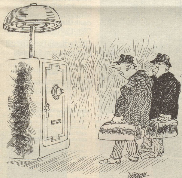
«Verflucht – diesen Sonderalarm muss Herr Chevallaz nach dem 8. Dezember in die Bundeskasse gebaut haben!»