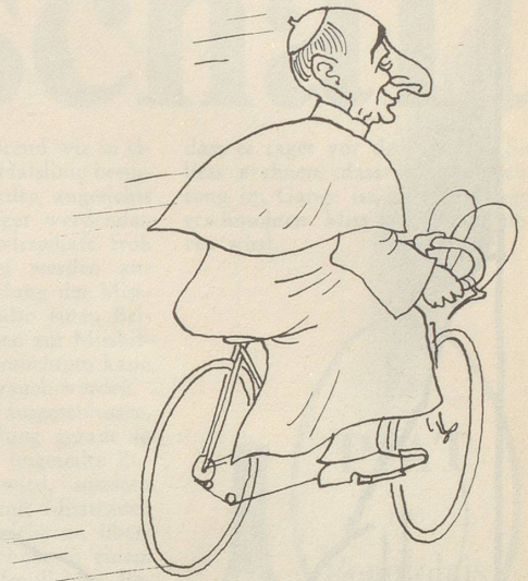
Eddy Merckx' Beitrag zur Linderung der vatikanischen Finanzmisere