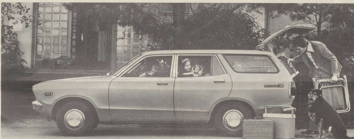
Datsun Sunny Wagon