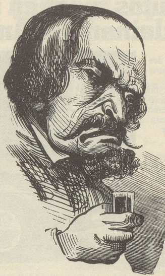
1854: Die «Times» schreibt ...

ten», verschwand das homunkulushafte Aderlassmännchen («ein abergläubisches, schädliches Orakel») aus dem Kalender. Aber – ein paar Jahre später war es wieder drin. Und es blieb bis 1873 im «Bürkli».