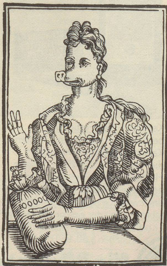
1774: Frauenzimmer, nicht schön, aber mit 100 000 Talern, sucht «Heiraths-gelegenheit».

Er schildert auch des Kalendermannes Kampf mit dem Mittelalter. Neben dem Monats-Kalendarium mit Wetterregeln und Jahrmärkte-Verzeichnis bildeten astronomische und astrologische Aspekte einen wichtigen Teil des Kalenders. Dazu kam das «Aderlassmännchen», eine astrologisch-medizinische Schauffigur, die neben Anweisungen zum «Schrepfen, Baden und Purgieren» anzeigte, an welchen Körperstellen in welchem Tierkreiszeichen zu Ader gelassen werden sollte. 1799 dann, als die Franzosen den «helvetischen Stall mit einem eisernen Besen auswisch-