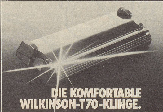
DIE KOMFORTABLE WILKINSON-T70-KLINGE.