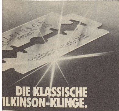
DIE KLASSISCHE WILKINSON-KLINGE.