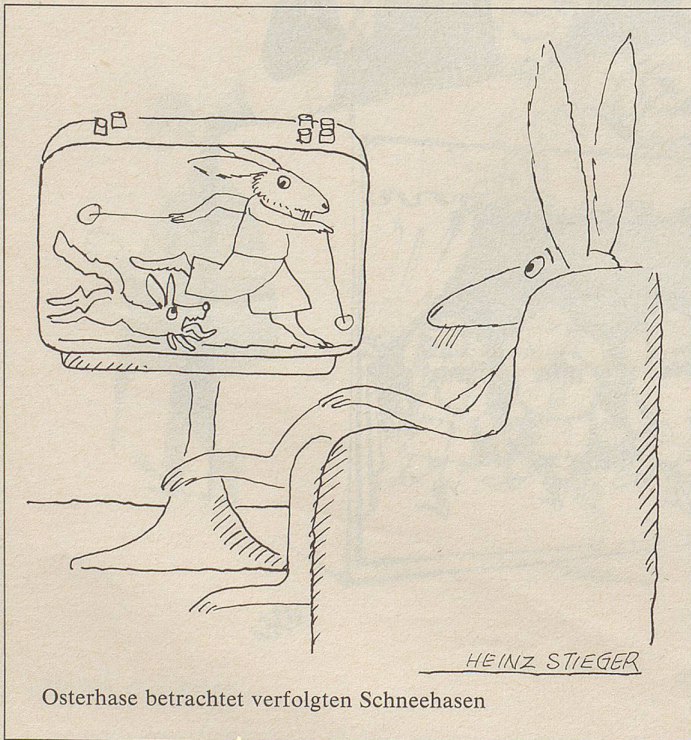
Osterhase betrachtet verfolgten Schneehasen