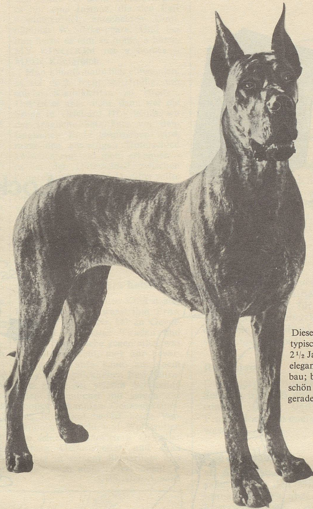
Diese Deutsche Dogge ist ein typischer Chappi-Hund: 2 1/2 Jahre alt; 44 kg schwer; eleganter, kräftiger Körperbau; breite Brust, langer, schön geschwungener Hals; gerade und starke Läufe.