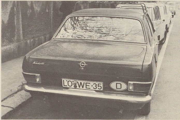
... und trotzdem den Tiger im Tank ...!?

durch verschiedene Schulstufen. Humorvoll, oft mit kritischer Ironie beschreibt Ruth Blum die Erlebnisse ihrer Schulstubejahre.