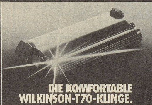
DIE KOMFORTABLE WILKINSON-T70-KLINGE.