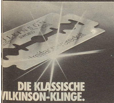
DIE KLASSISCHE WILKINSON-KLINGE.