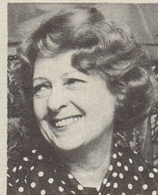
... beim Lachen