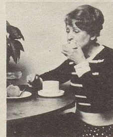
... beim Essen

Smig ist ein spezielles Haftkissen aus weichem Plastik, das leicht einzusetzen ist als Polster zwischen Kiefer und Prothese.