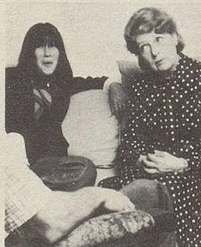
... beim Sprechen