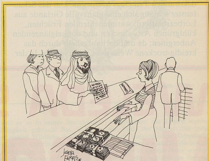
«Nur keine Panik, das ist nur ein Einführungsschreiben. Ich möchte eine grössere Einzahlung machen!»