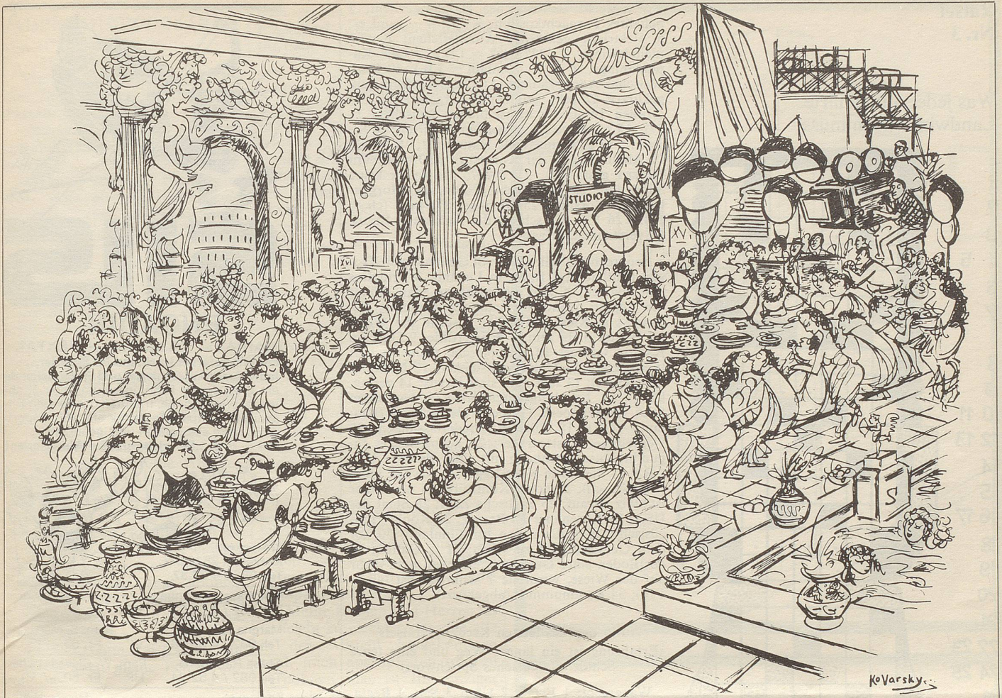
«Ich hoffe, dass die Aufnahme wiederholt werden muss. Diese Kirschtorte ist ausgezeichnet.»