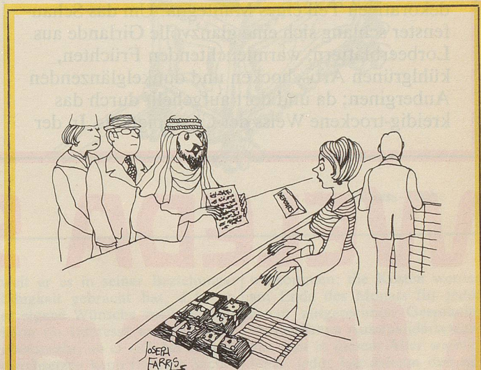
«Nur keine Panik, das ist nur ein Einführungsschreiben. Ich möchte eine grössere Einzahlung machen!»