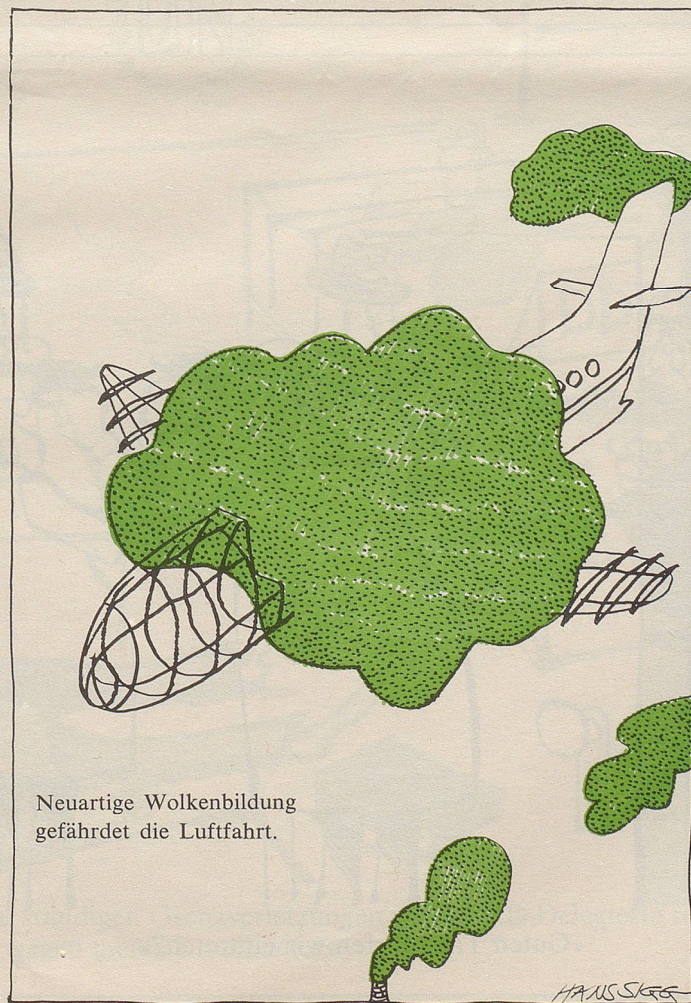
Neuartige Wolkenbildung gefährdet die Luftfahrt.