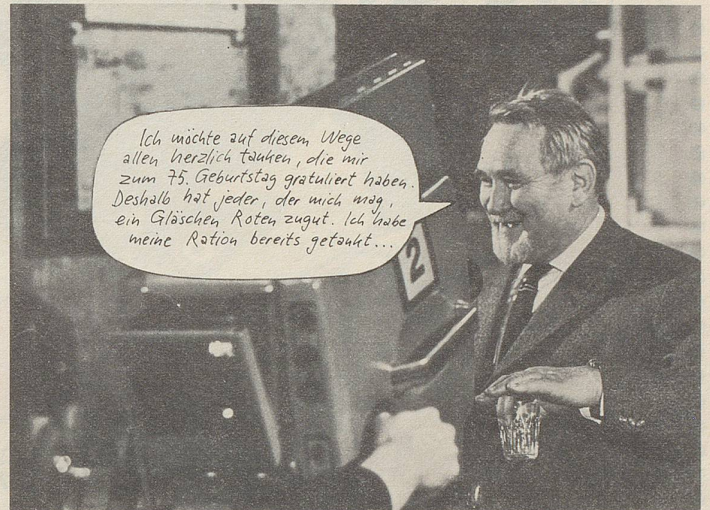
Jubilär Gustav Knuth vor der TV-Kamera