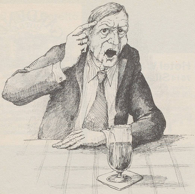
«Wo kämen wir denn hin, wenn sich alle unentwegt auf die Bundesverfassung beriefen?» (Zeichnungen: Kurt Halbritter)