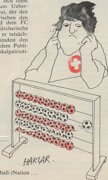
Sorgenkind der (Fussball-)Nation ...