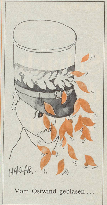
Vom Ostwind geblasen ...

Zum Vorwurf des Angsteinjagens wäre festzustellen, dass andere Tatsachenberichte – auch aus der Tagesschau – über Krieg, Aufstände etc. oft grauenvoll sind, aber eben, weiter weg. In der unmittelbaren Nähe sollte die Welt möglichst heil bleiben. Es wehrt sich scheinbar auch niemand gegen die im Schweizer Fernsehen noch und noch gezeigten amerikanischen 20jährigen Krimifilme (oft am Sonntagabend). Solch flache Unterhaltung reizt of-