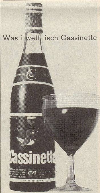
Was i wett, isch Cassinette

Cassinette ist gesundheitlich wertvoll durch seinen hohen Gehalt an fruchteigenem