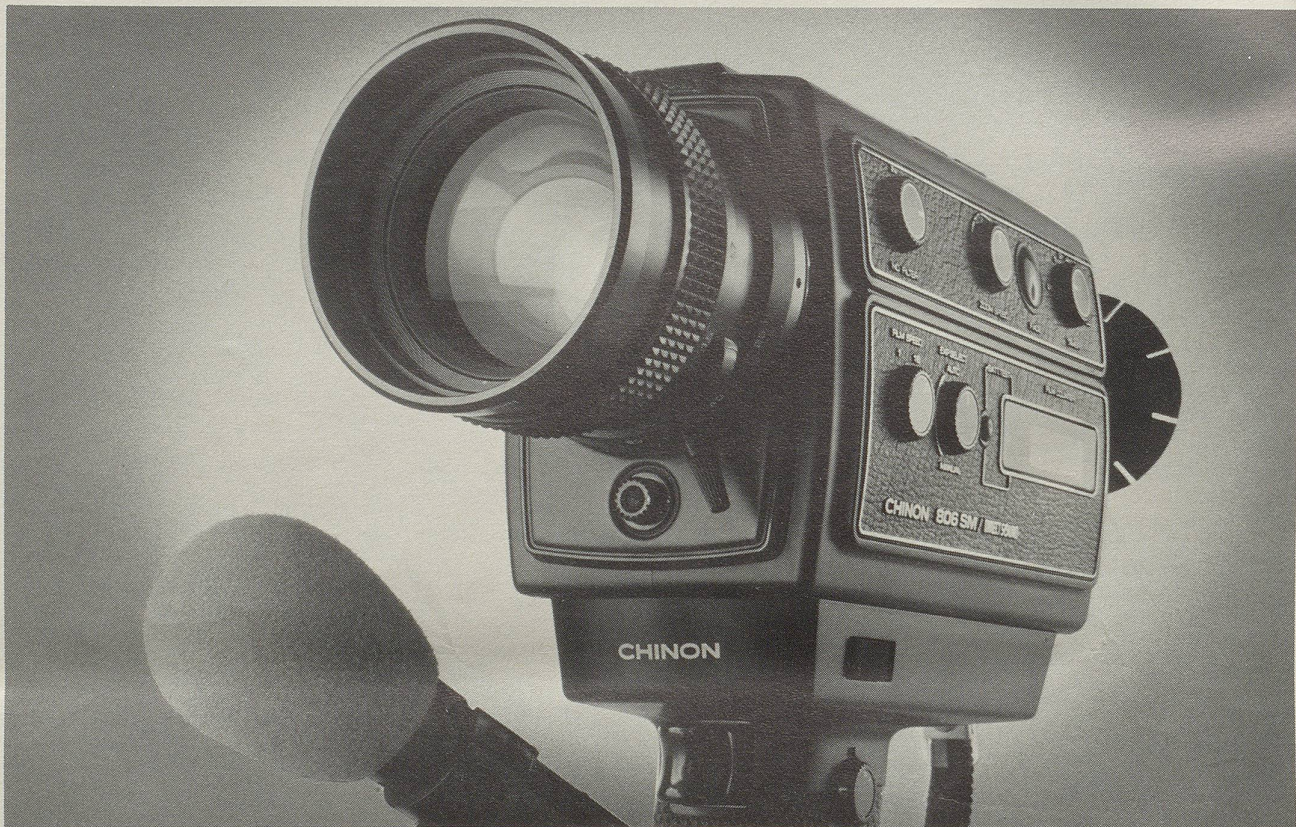
Abbildung: Modell 806 SM Chinon-Tonfilmkameras gibt es bereits ab Fr. 590.-

Tonfilmen, aber womit? Kamera-Käufer stehen verunsichert vor einem beinahe nicht mehr überblickbaren Kamera-Angebot. Welche Marke muss man kaufen, damit man seinen Entschluss nicht bereut?