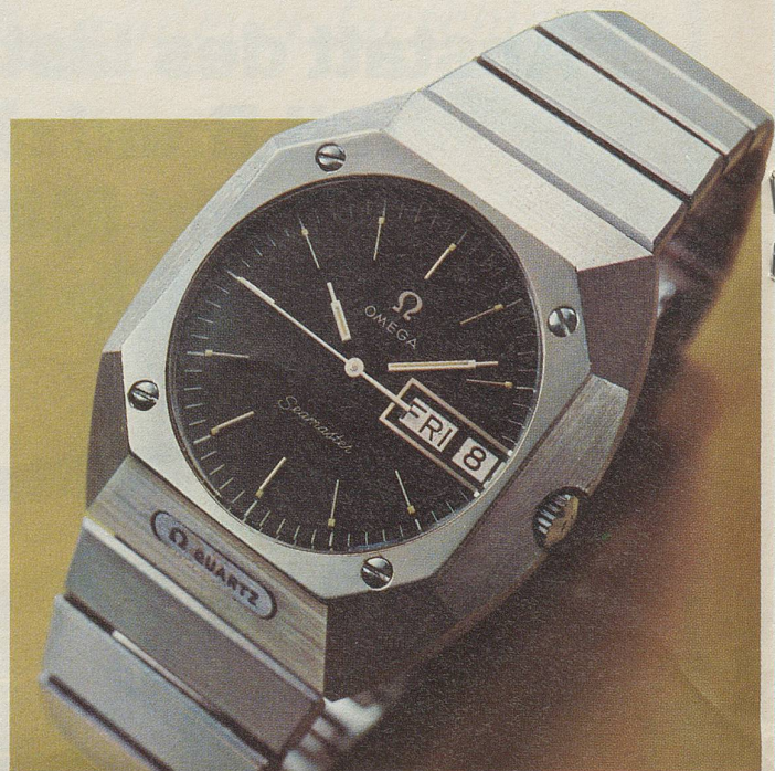
Der Quarzkristall einer Seamaster 1 schwingt pro Sekunde genau 32 768 mal. Exklusiver Mikromotor. Maximale Gangabweichung: 5 Sek./Monat. Ref. 5877, Edelstahl, Fr. 1000.-.

Und natürlich hat auch die neueste Generation jene Eigenschaften, die Omegas Seamaster berühmt gemacht haben: Zuverlässigkeit, Robustheit, Unverwüstlichkeit – erprobt unter dem Meeresspiegel, auf der Erde, im Weltraum. Aber nun verbunden mit quarzelektronischer Präzision.