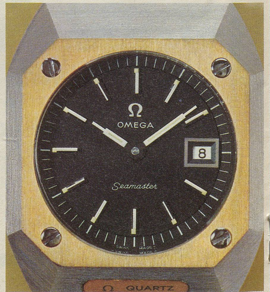
Bei der Herstellung des Gehäuses werden für die Astronautik entwickelte Techniken verwendet. Kratzfestes Saphirglas. Wasserdicht bis 3 atü.