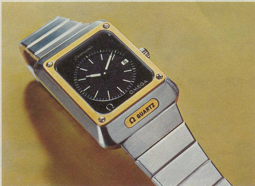
Auf das Gehäuse geschraubte Lunette aus 14 Karat Gold, ganz im Stil der Seamaster Kollektion: Sportlichkeit und Eleganz. Ref. 5866, Edelstahl, Fr. 1050.-.