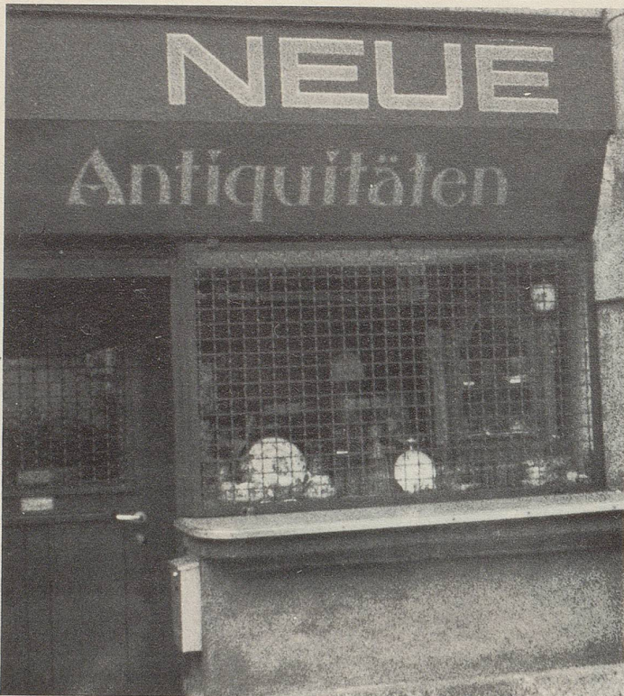
Am Hirschengraben in Zürich