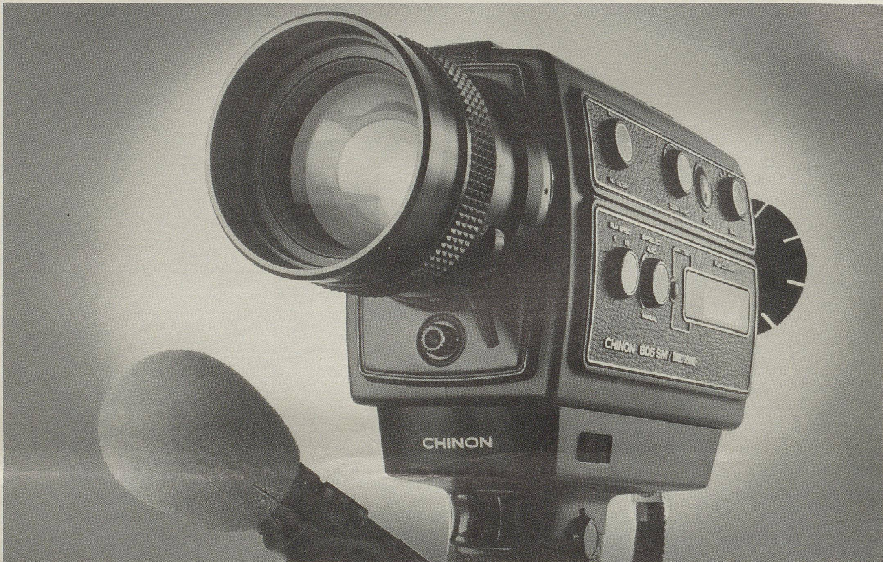
Abbildung: Modell 806 SM Chinon-Tonfilmkameras gibt es bereits ab Fr. 590.-.

Tonfilmen, aber womit? Kamera-Käufer stehen verunsichert vor einem beinahe nicht mehr überblickbaren Kamera-Angebot. Welche Marke muss man kaufen, damit man seinen Entschluss nicht bereut?