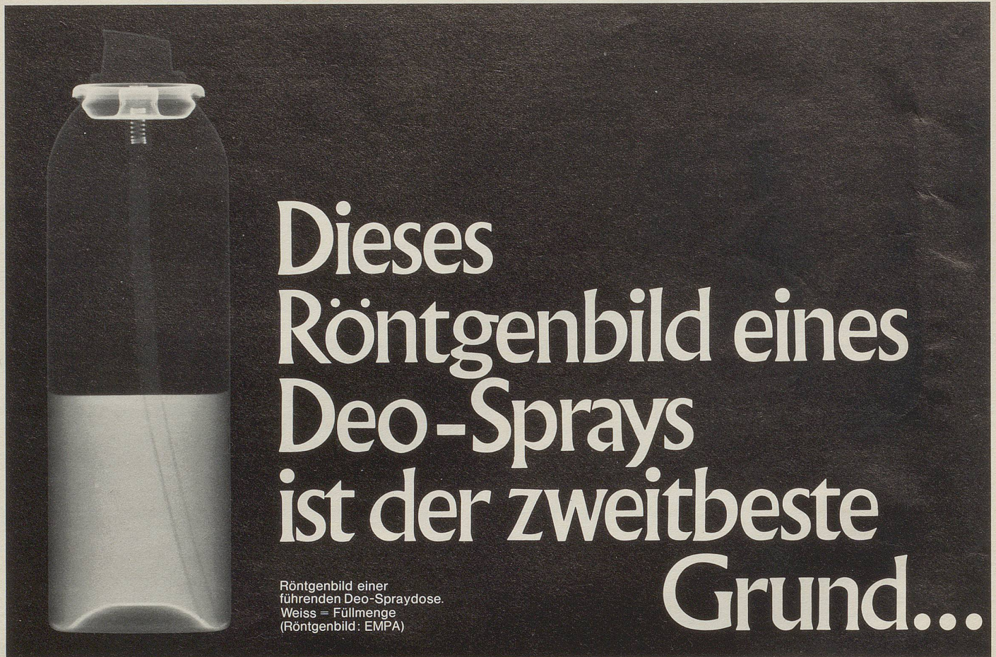
Röntgenbild einer führenden Deo-Spraydose. Weiss = Füllmenge