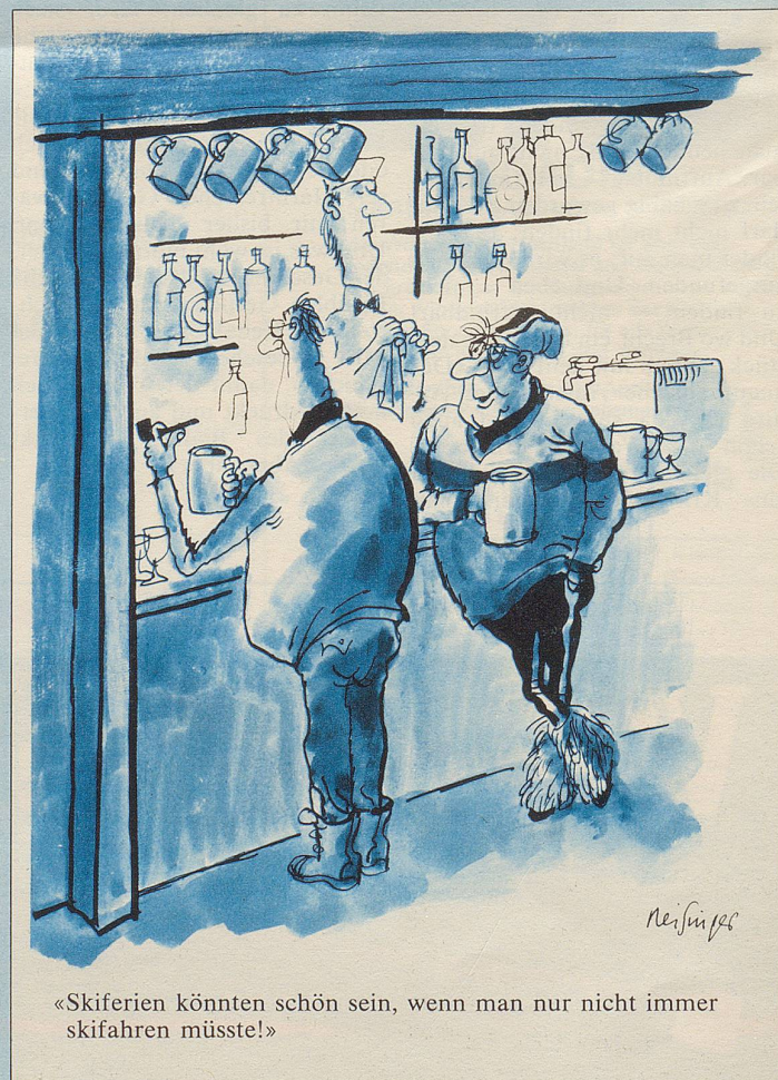
«Skiferien könnten schön sein, wenn man nur nicht immer skifahren müsste!»