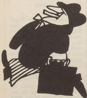
Das herkömmliche Bild, das Karikaturisten vom Unternehmer (Kapitalisten) machen.

Gerade weil ich Ihren Vorwurf für schwerwiegend halte für Leute, die sich für Marxisten halten oder es sind, oder für zu sehr willkommen für jene, die Marxisten beföhden, glaube ich, dass Sie es bei Ihrem polemischen Seitenhieb nicht bei einer blossen Behauptung bewenden lassen dürfen, ganz abgesehen davon, dass damit ein aktueller Bereich der politischen Diskussion anklängt, denn es wird heute in solcher Diskussion so häufig «der Spur nach gemogelt», dass ich es für gerechtfertigt halte, wenn ich Ihnen noch gezielter auf den Zahn fühle. Leo Bühler