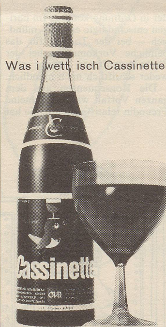
Was i wett isch Cassinette