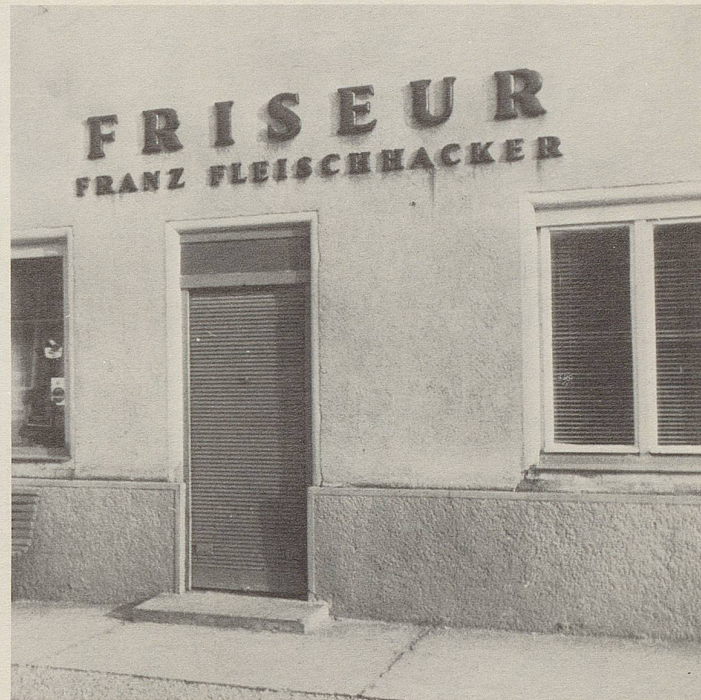
In einer Ortschaft am Neusiedlersee

In einer Gesellschaft sagte die Marquise Du Deffand, sie wisse das sicherste Mittel gegen die Versuchung. Als die andern sie bestürmten, ihnen das Mittel doch zu verraten, denn anscheinend war die Versuchung damals eine epidemische Krankheit, sagte sie: