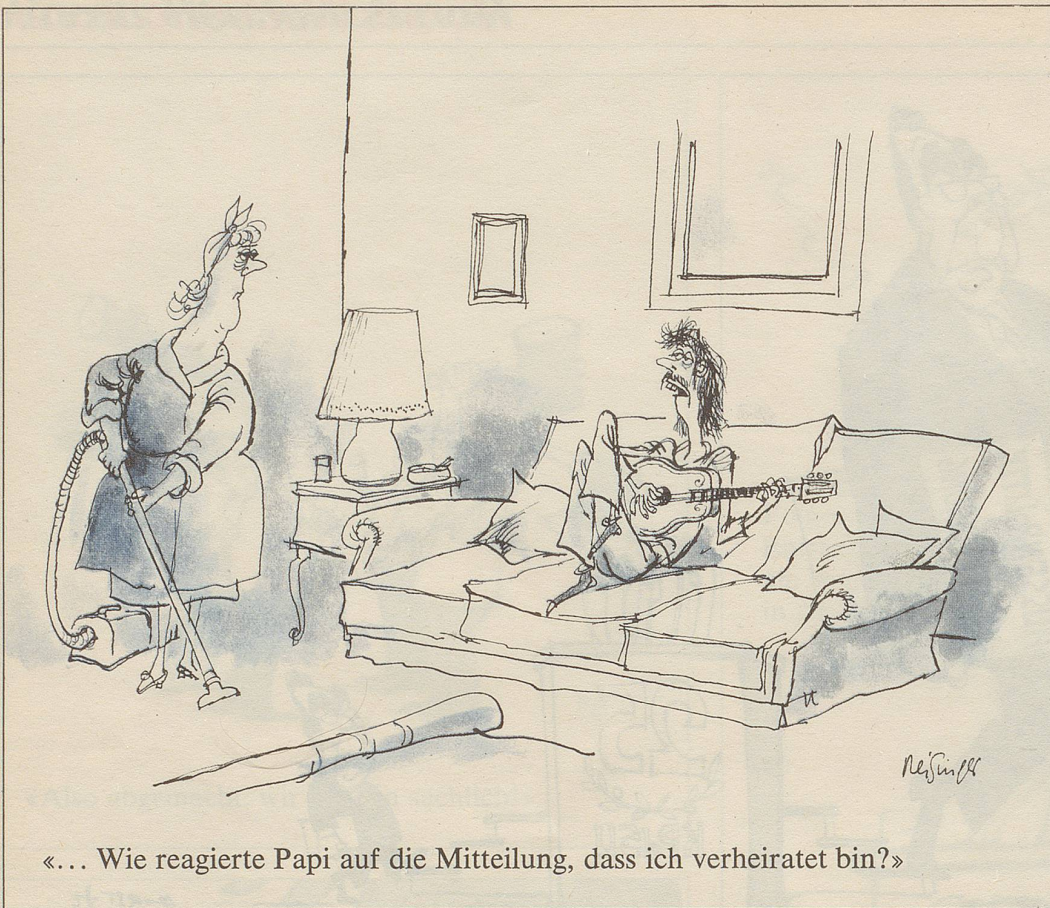
«... Wie reagierte Papi auf die Mitteilung, dass ich verheiratet bin?»

«Ich bitte um eine Hilfskraft, weil ich meinem Mann den Haushalt führen muss. Ausserdem benötigt er mich noch zu andern Dingen.»