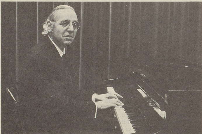
Unternehmer der Beruhigungs- und Tröstungsindustrie: Georg Kreisler