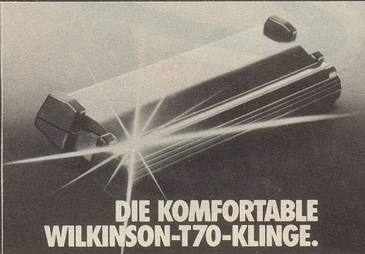
DIE KOMFORTABLE WILKINSON-T70-KLINGE.