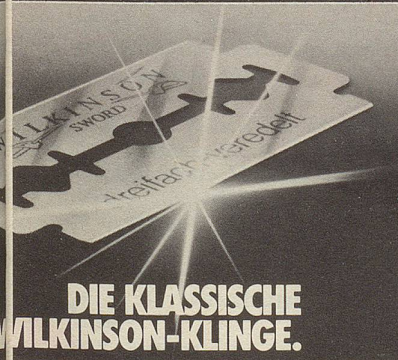
DIE KLASSISCHE WILKINSON-KLINGE.