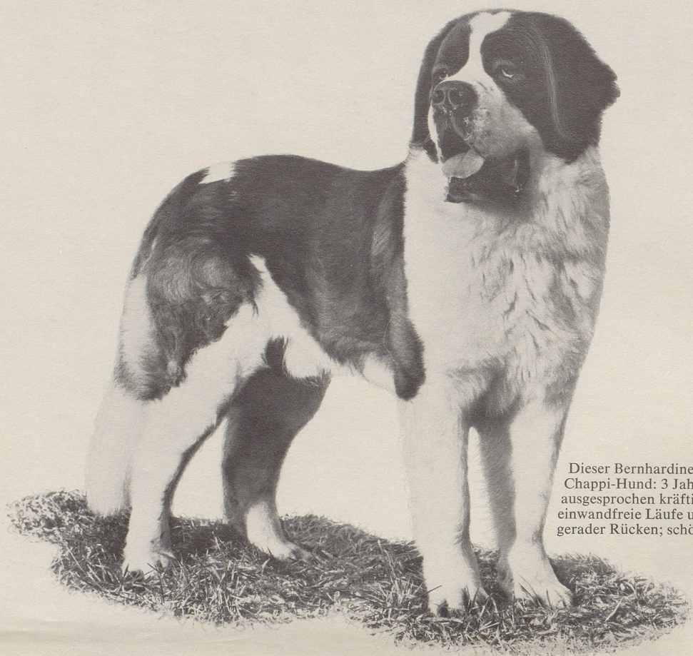
Dieser Bernhardiner ist ein typischer Chappi-Hund: 3 Jahre alt; 78 kg schwer; ausgesprochen kräftiger Knochenbau; einwandfreie Läufe und guter Stand; gerader Rücken; schöne Rutenhaltung.