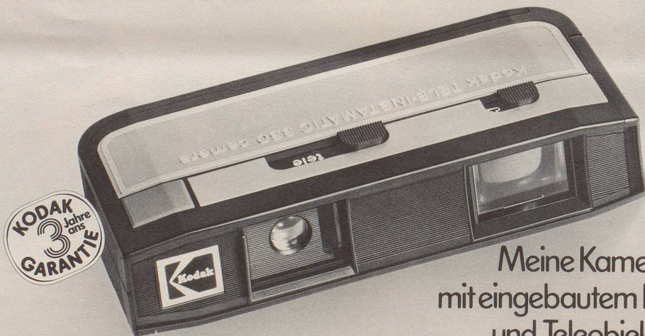
Meine Kamera, mit eingebautem Normal- und Teleobjektiv.