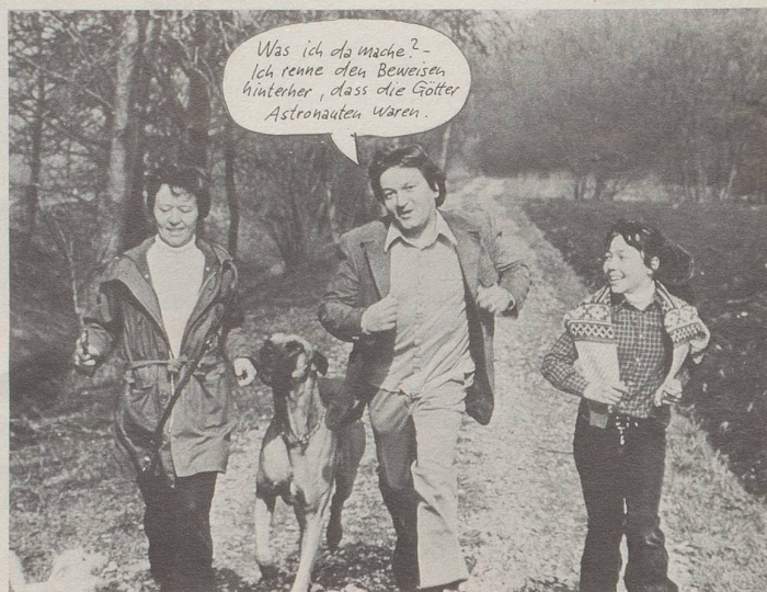
Erich von Däniken, der soeben sein neues Buch «Beweise» vorgelegt hat.