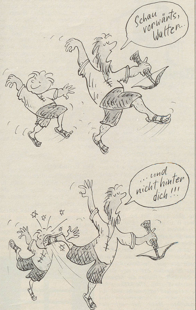
Zeichnung: Magi Wechsler

In Zürich wird zurzeit das Musical «Wilhelm Tell!» aufgeführt.