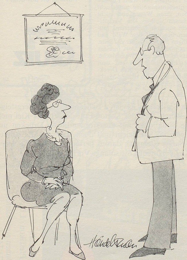
«Das wirksamste Mittel gegen diese Art von Schmerzen ist, einfach nicht darauf zu achten!»