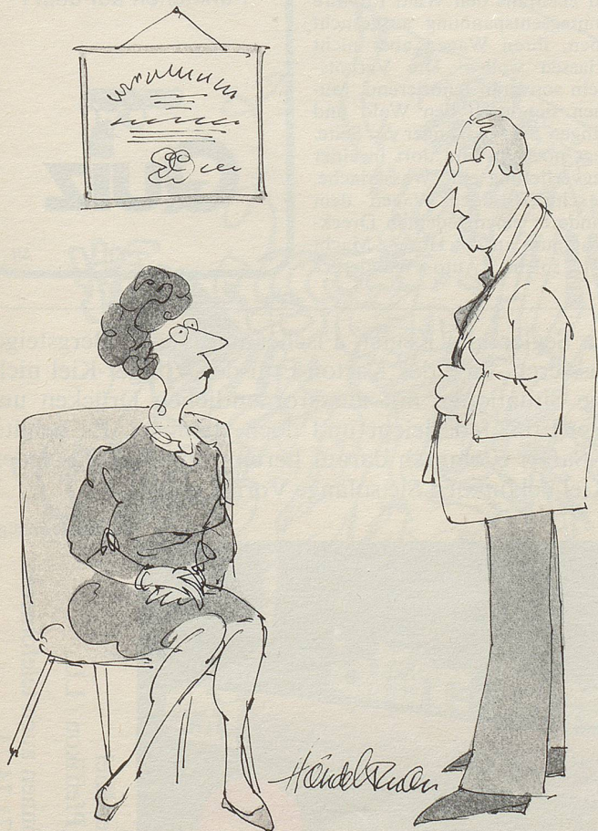
«Das wirksamste Mittel gegen diese Art von Schmerzen ist, einfach nicht darauf zu achten!»