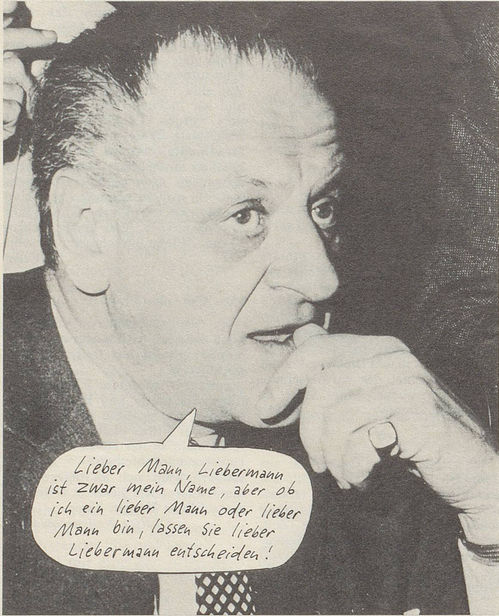
Opernhaus-Intendant Rolf Liebermann

Lieber Mann, Liebermann ist zwar mein Name, aber ob ich ein lieber Mann oder lieber Mann bin, lassen Sie lieber Liebermann entscheiden!