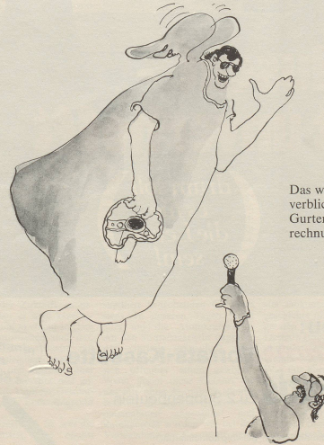
Das war das schlichte Motto des soeben verbliebenen Sportwagenfahrers Klaus M.: «Keine Gurten tragen und also auch keine teuren Arztrechnungen bezahlen müssen!»