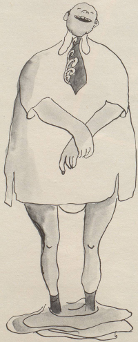
«Wie frei man sich fühlt ohne Gurtenzwang!»