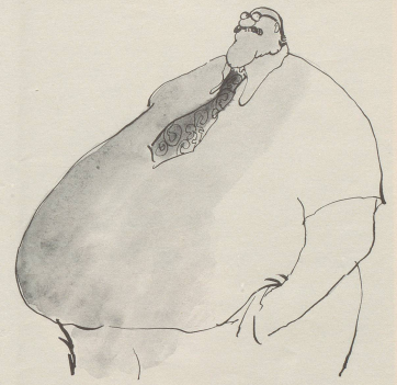
«Der Entscheid war richtig», sagte ein Gastwirt aus Thun. «Eine Knautschzone vorne ist wichtiger als Gurten!»